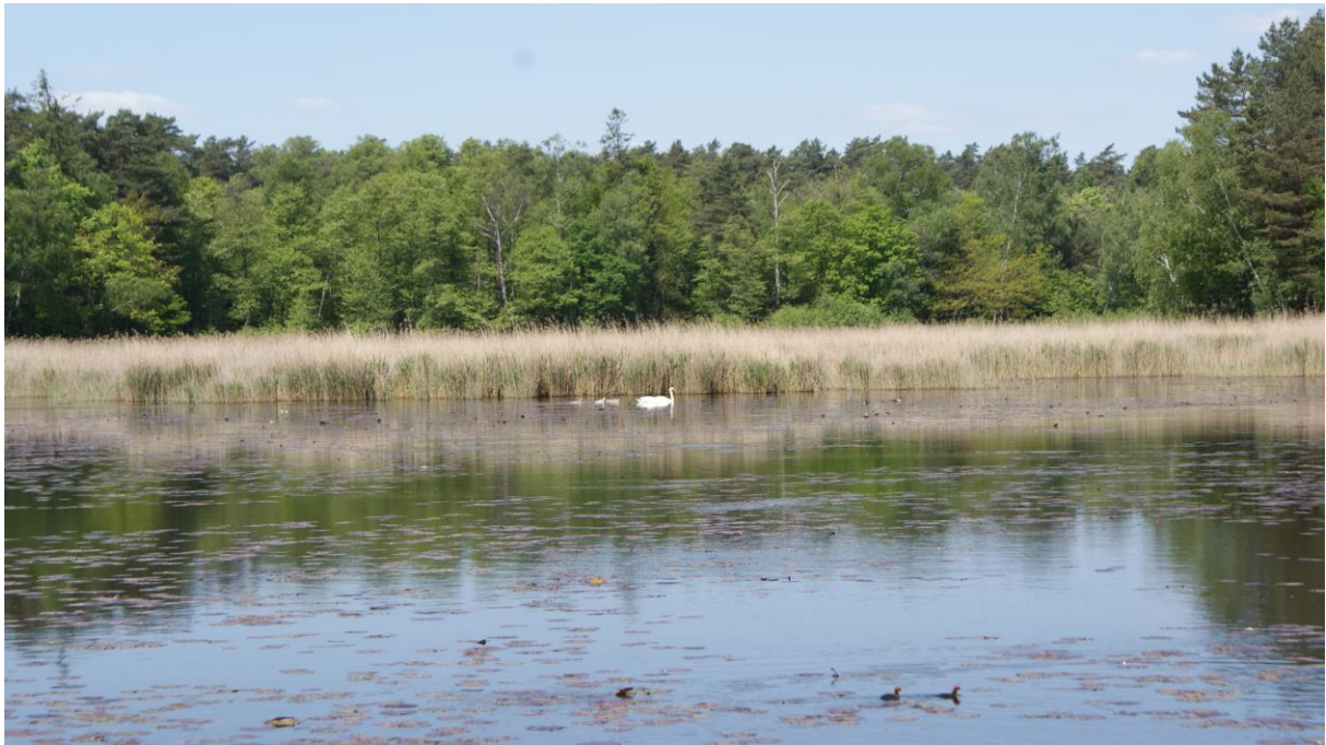
Nowy Staw z trzcina