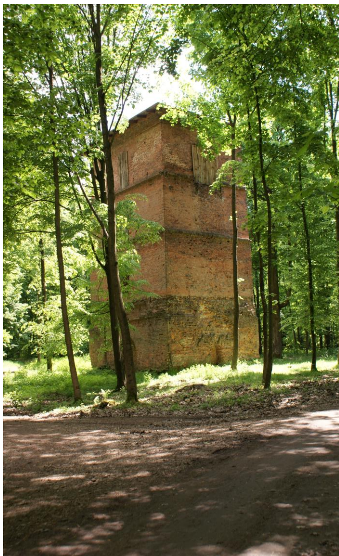
Zabytkowa huta Waleska (Gichta)