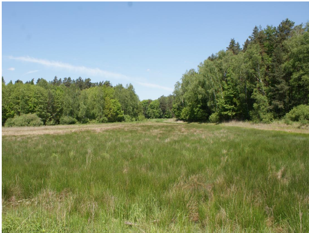
Widok na zarośnięty staw Koliok (na północny-zachód) otoczony drzewami