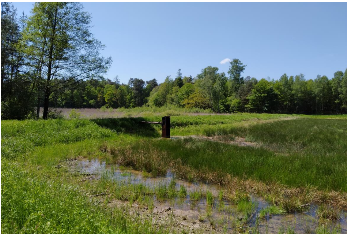
Charakterystyczne urządzenia hydrotechniczne na stawach rybnych